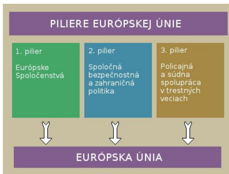
Obrázok 1: Pilieri EÚ

Maastrichtská zmluva ustanovuje nové právomoci EP, najmä legislatívne právomoci v oblasti voľného pohybu pracovných síl, práva podnikania a usádzania sa v inom štáte EÚ, práva ponuky služieb v iných štátoch EÚ. Právomoci sa posilnili tiež aj v ďalších oblastiach fungovania vnútorného trhu Európskej únie, školstva a vzdelávania, spotrebiteľskej politiky, transeurópskych sietí, kultúry, výskumu a životného prostredia. Maastrichtská zmluva tak posilnila postavenie Európskeho parlamentu vo vzťahu k Európskej komisii a Európskej Rade. 8 Maastrichtská zmluva predstavovala podstatnú revíziu zakladajúcich zmlúv Európskych spoločenstiev, najmä Zmluvy o EHS, resp. ES. Podľa článku 138c (po revízii Amsterdamskej zmluvy a Zmluvy z Nice čl.193) EP má právo pri plnení úloh (na požiadanie jednej štvrtiny svojich členov) zoskupiť dočasnú vyšetrovaciu komisiu (výbor), ktorej hlavnou úlohou bude sa zaoberať porušovaním práva Spoločenstva alebo nesprávneho úradného postupu pri jeho uplatňovaní. 9