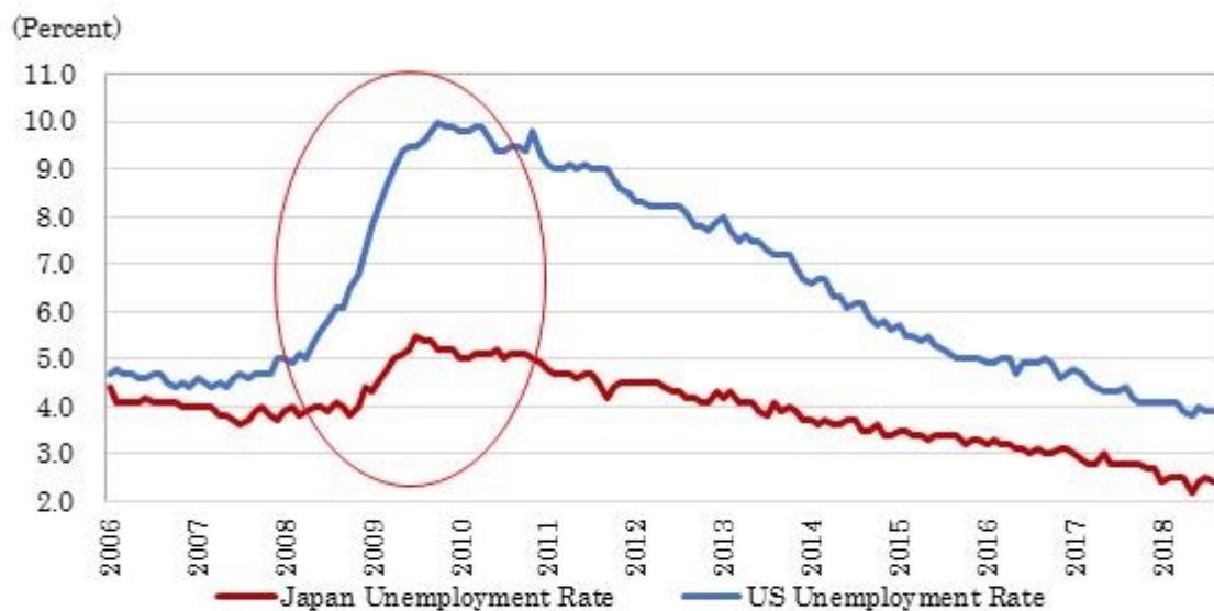
Graf 1 Vývoj nezamestnanosti Japonska a USA v rokoch 2006-2018

(Data Source) Japan: Cabinet Office, United States: Federal Reserve Bank of St. Louis