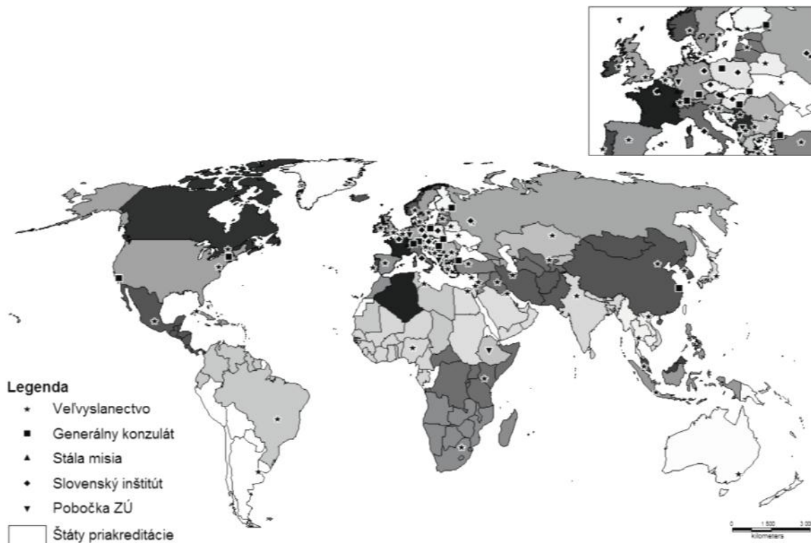
Obr.č.1: Sieť zastupiteľstiev SR v zahraničí v roku 2009

Lokalizáciu jednotlivých slovenských zastupiteľstiev vo svete graficky znázorňuje i nasledujúca mapa (obr.č.1).