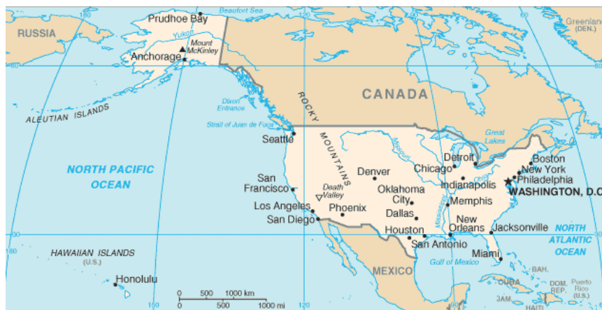
Obrázok 1: Geografické usporiadanie USA