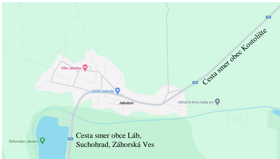
Príloha č.1: Mapa obce Jakubov