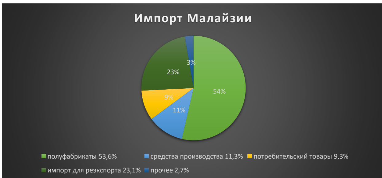
Рис. 3.5. Экспорт и Импорт