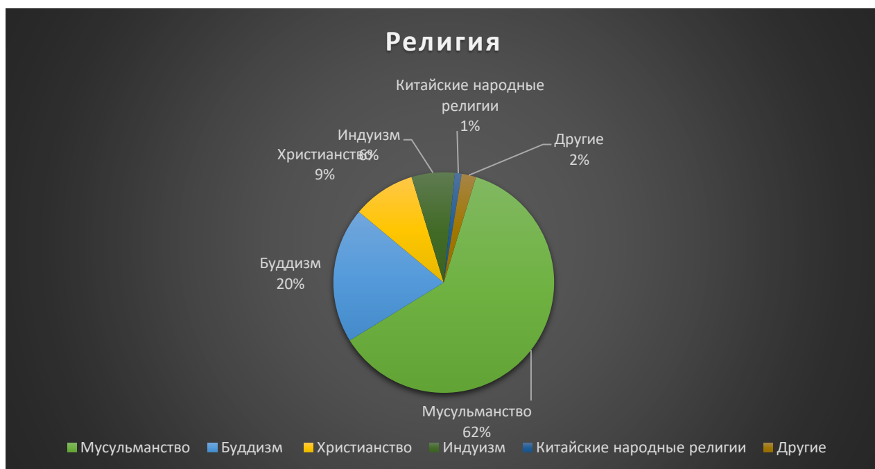
Рис. 1.2 Религия

Рисунок 1.2. сформирован на основе данных сайта, но оформлена автором этого доклада 11 .