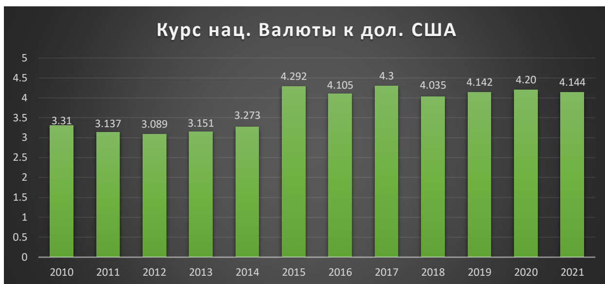
Рис. 3.6. Курс нац. Валюты

Рисунок 3.6. сформирован на основе данных сайта, но оформлена автором этого доклада 29 .