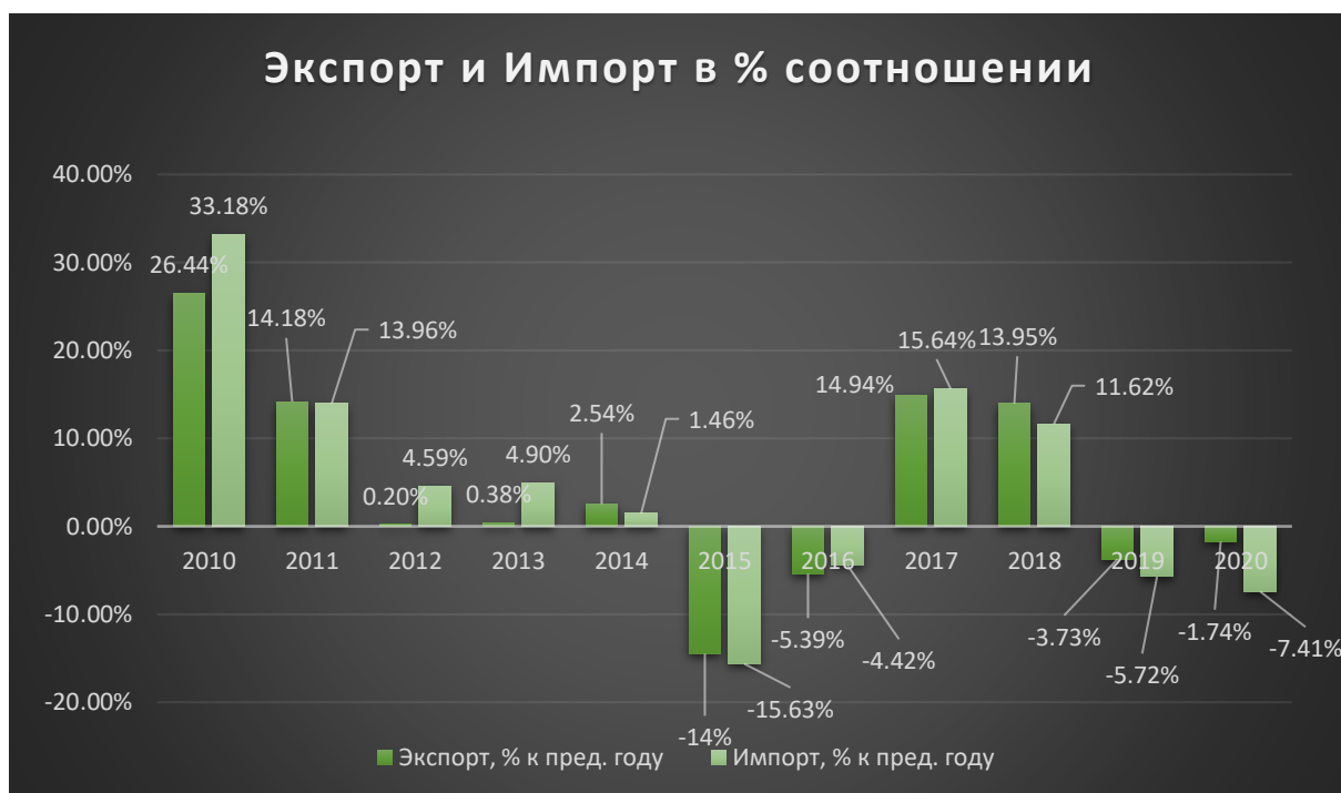
Рис. 3.2. Экспорт и импорт

Рисунок 3.2. сформирован на основе данных сайта, но оформлена автором этого доклада 26 27 .