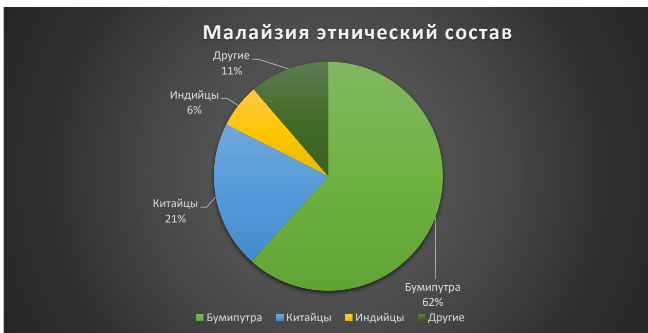
Рис. 1 Малайзия этнический состав

Бумипутра — наименование этнической группы малайцев, а также коренного населения Малайзии.