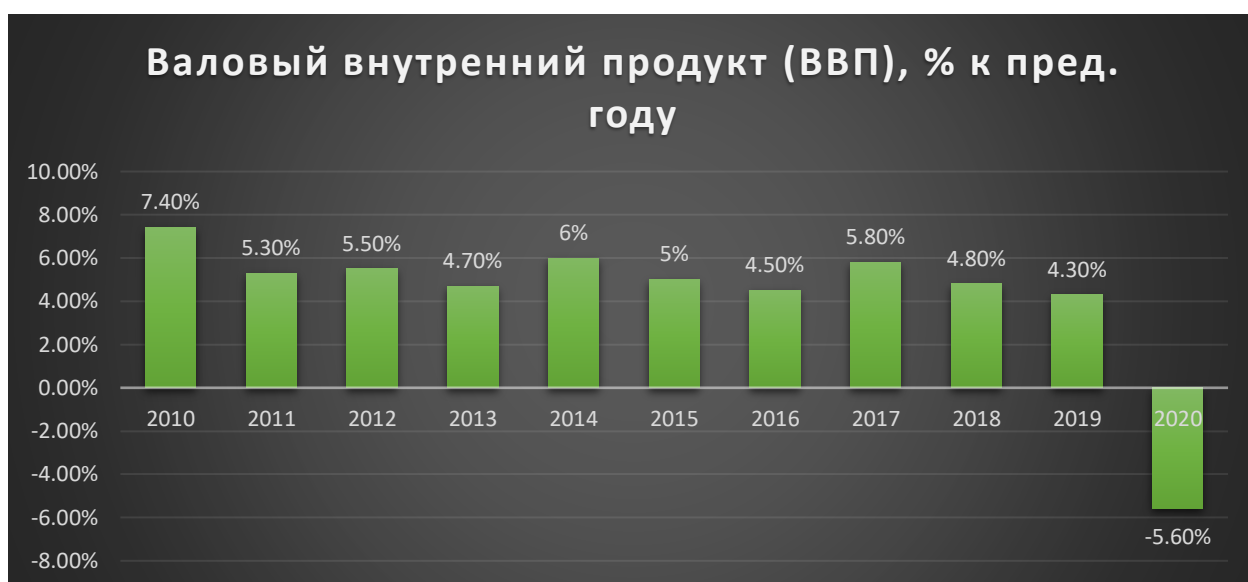
Рисунок 3.7. сформирован на основе данных сайта, но оформлена автором этого доклада 31 .