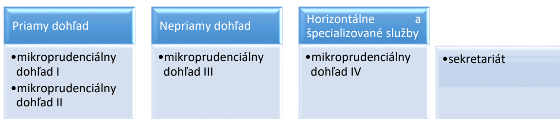
Obrázok č.2: Nové odborné útvary v Európskej centrálnej banke