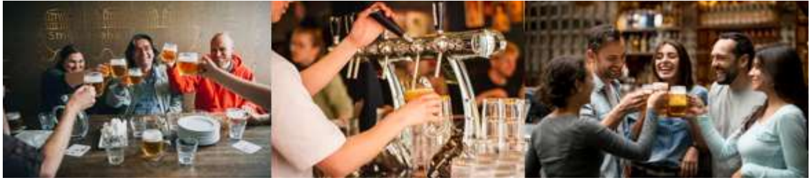
Obrázky zobrazené pre Skupinu A