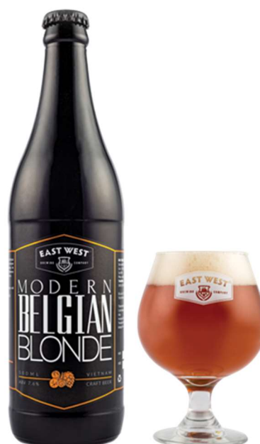
Obrázok pre Skupinu B