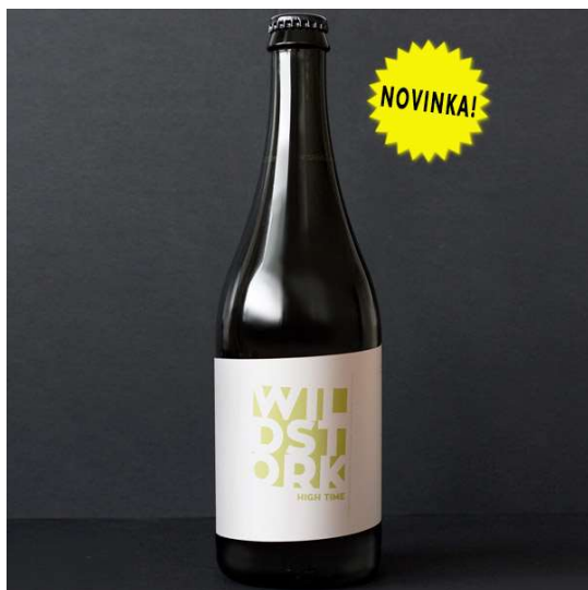
Obrázok pre Skupinu A

Otázka 5: Pozrite si obrázok a odpovedzte na otázku.