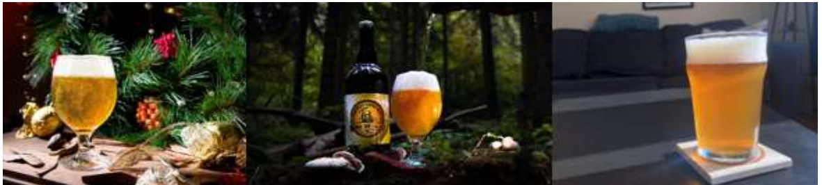
Obrázky zobrazené pre Skupinu B

Pozrite si obrázok a odpovedzte na otázku.