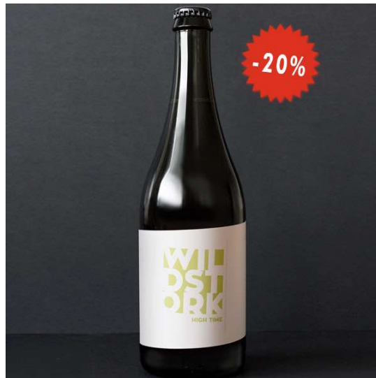
Obrázok pre Skupinu B

Ak by ste mali popísať kvalitu piva len podľa toho čo vidíte na fotografii, kam by ste ho na stupnici 1-10 zaradili vy?