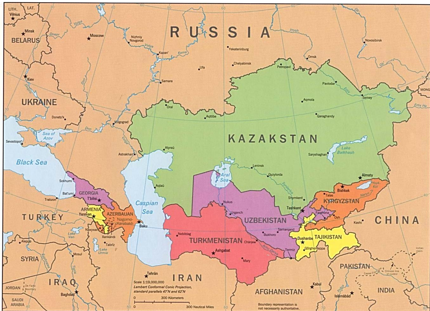
Obrázok 1: Politická mapa Strednej Ázie