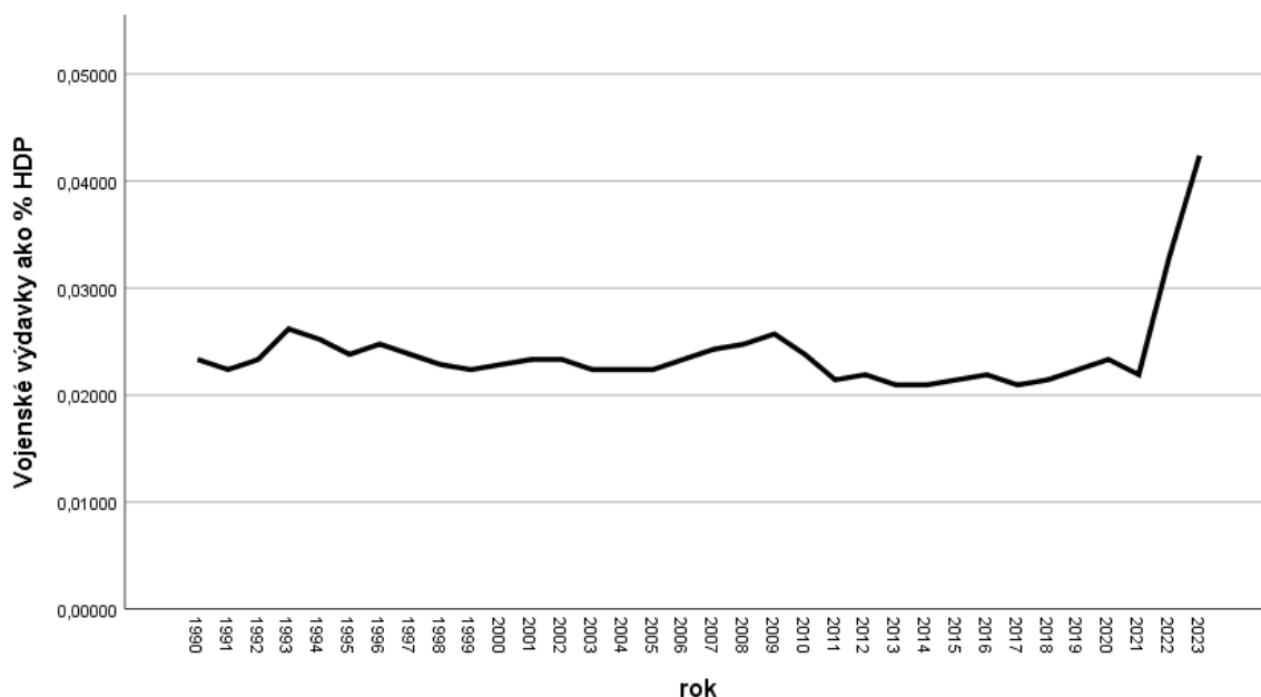
Graf 3: Priemer vojenských výdavkov ako % HDP podľa jednotlivých rokov. Os X znázorňuje percentuálne hodnoty v desatinnom formáte

Zdroj: vlastné spracovanie podľa dát SIPRI