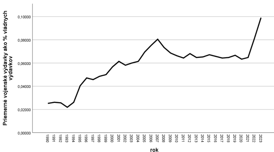
Graf 2: Priemer vojenských výdavkov ako % vládnych výdavkov podľa jednotlivých rokov. Os X znázorňuje percentuálne hodnoty v desatinnom formáte