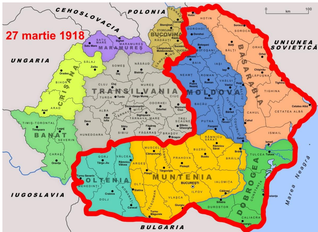
Obrázok 3: Mapa Rumunska v 1918 po pripojení Besarábie k Rumunsku (červenou) 1314

Po zjednotení a prijatí nových zákonov začala diskriminácia menšín. Zakázané bolo vydávanie novín v ruskom jazyku a na úradoch sa mohlo hovoriť iba rumunsky. S narastajúcim počtom prívržencov komunizmu, vzrastala aj myšlienka rozbitia Rumunska a znovu pripojenie Besarábie. V roku 1924 bola z tohto dôvodu vytvorená za riekou Dnester Moldavská autonómna sovietska republika, ktorej zámerom bolo neskôr sa pričleniť k Besarábii. Ruská federácia nepriamo v niekoľkých zmluvách s Rumunskom potvrdila, že „východná hranica Rumunska je tvorená riekou Dnester“. V komplikovanej situácii pred druhou svetovou vojnou však aj napriek snahe Rumunska dohodnúť sa s Ruskom o pakte o neútočení, všetky jednanja zlyhali aby uľahčili cestu k paktu