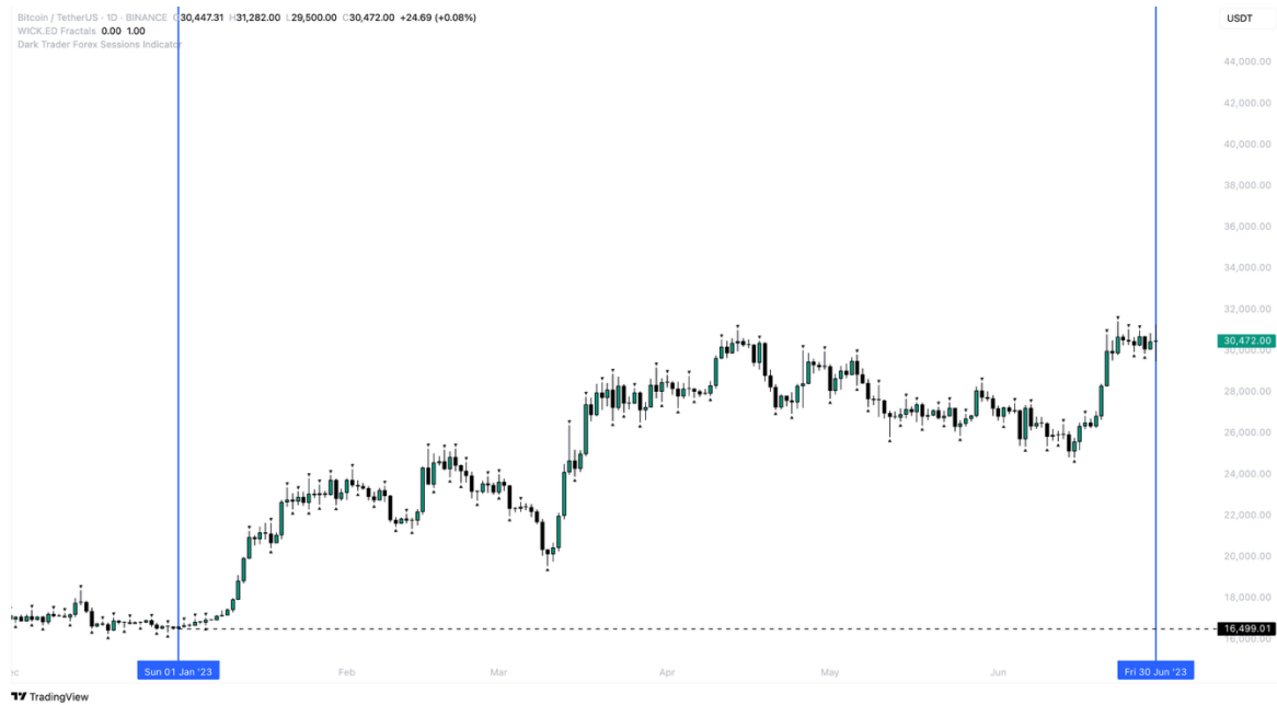
Príloha č.1: Vývoj ceny BTC/USDT v období január – jún 2023.