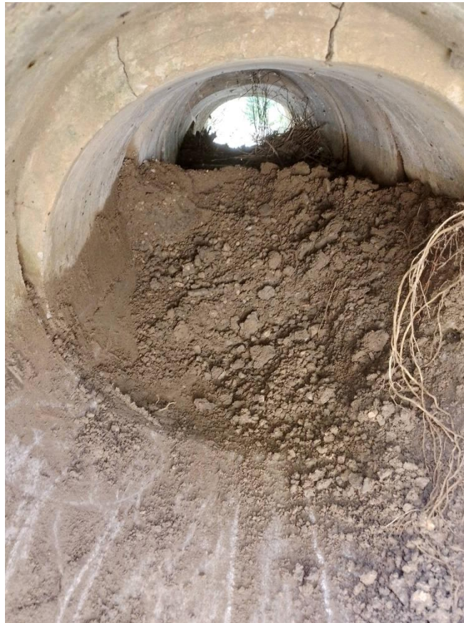
Obrázok 4 – Upchaný priepust nánosom a blatom