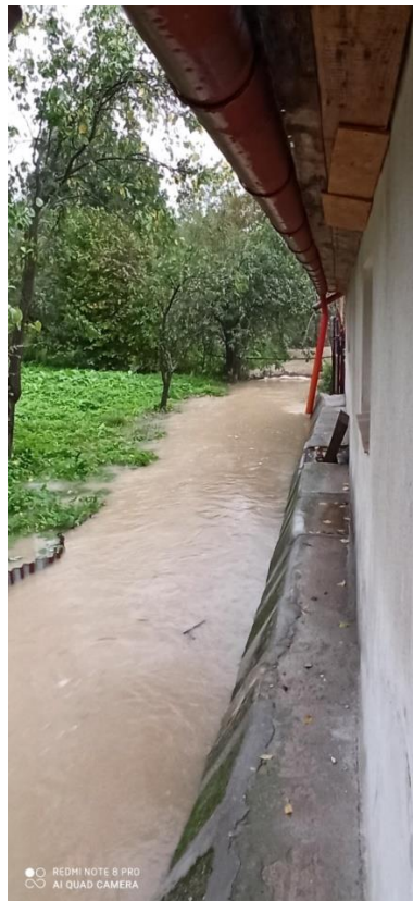
Obrázok 1 – Nahromadenie povrchovej vody na súkromnom pozemku