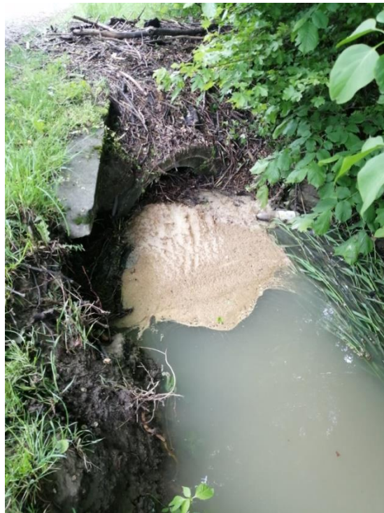
Obrázok 2 – Upchaný priepust konármi stromov