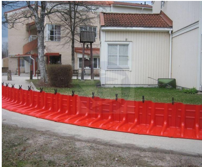
Obrázok 2 – Skladacie protipovodňové zábrany