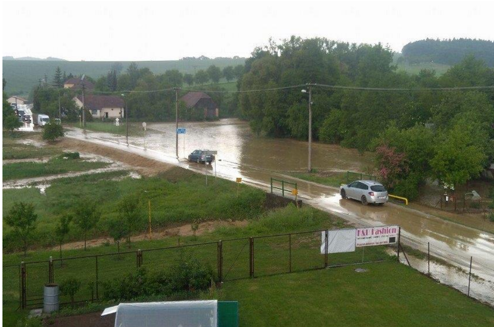
Obrázok 1 – Zaplavené územie mestskej časti Turá Lúka