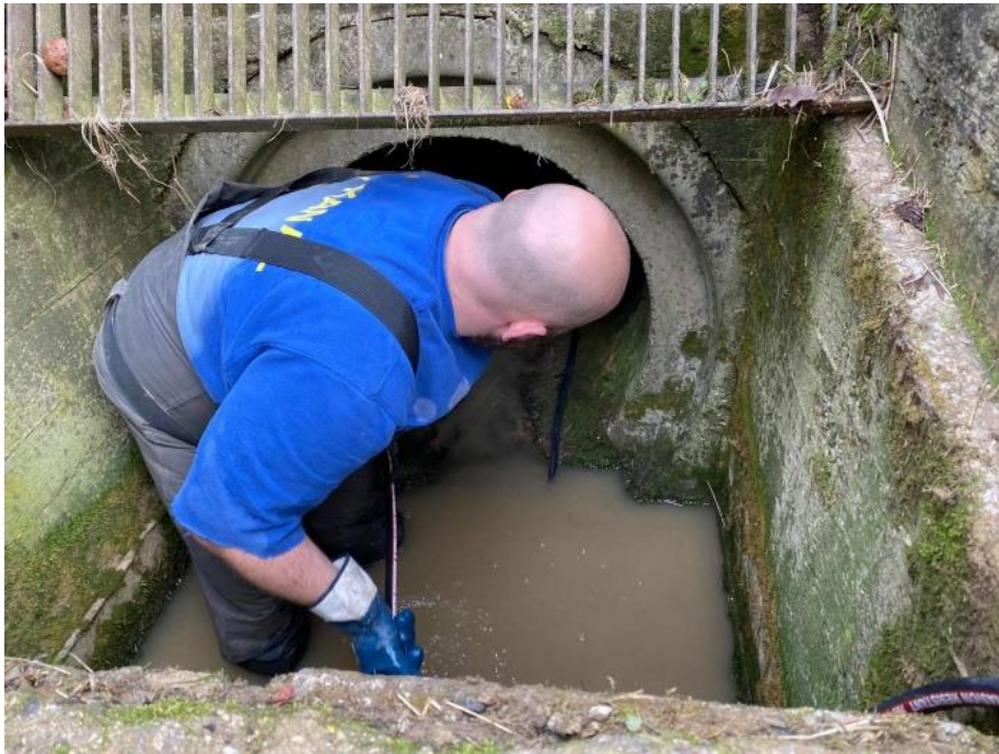
Obrázok 2 – Čistenie priepustu po povodni