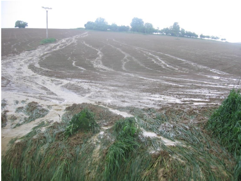
Obrázok 2 – Stekanie vody z poľa následkom povodne