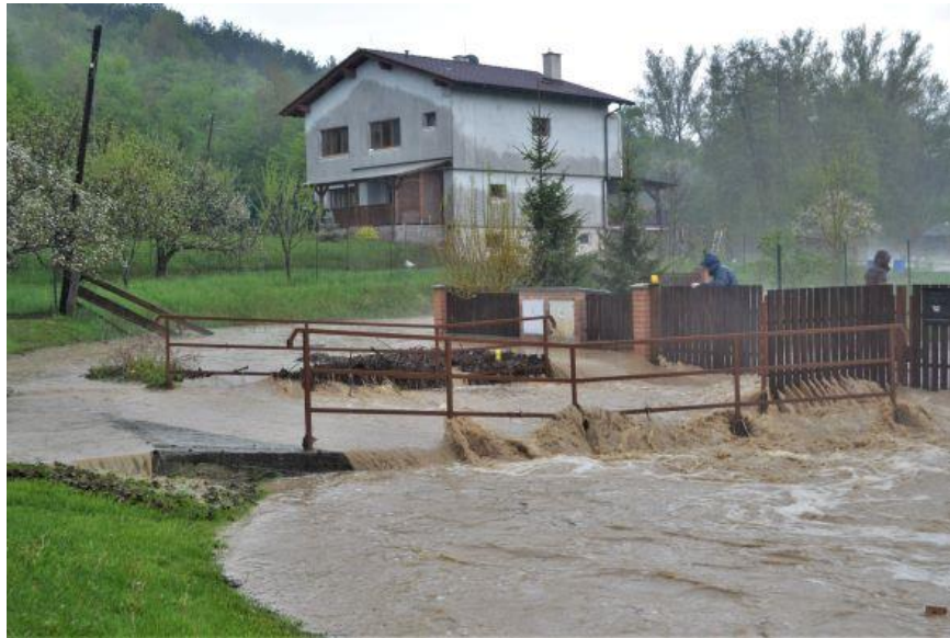
Obrázok 1 – Oblasť zasiahnutá povodňou