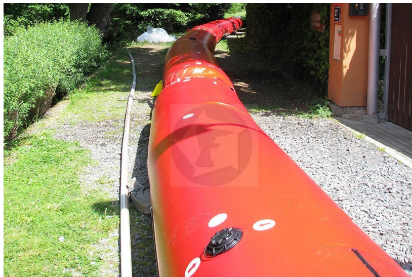
Obrázok 1 – Valcová protipovodňová zábrana