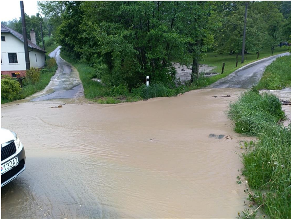
Obrázok 1 – Zaplavenie miestnej komunikácie v časti U Vankov