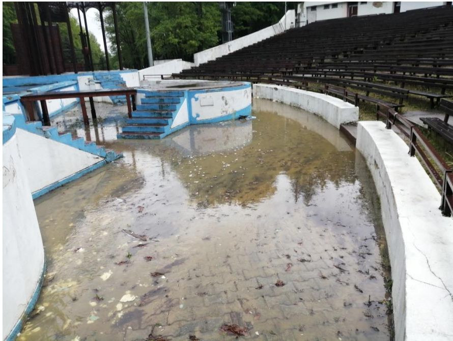
Obrázok 3 – Zaplavený amfiteáter Trnovce