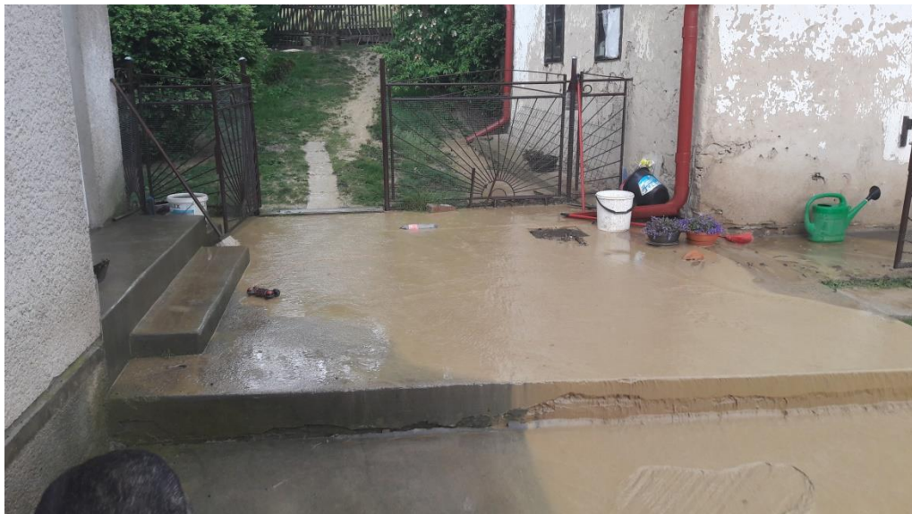
Obrázok 3 – Zaplavenie záhrady nánosom bahna