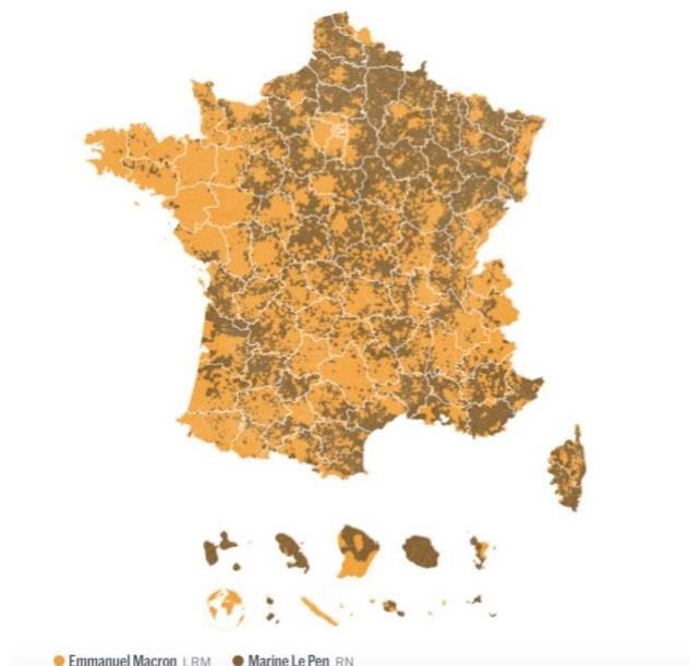
Obrázok č.1: Teritoriálna štruktúra voličov v prezidentských voľbách 2022