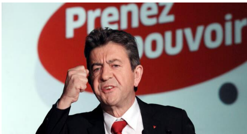
Obrázok č.2: Jean-Luc Mélenchon počas kampane v roku 2012

Zdroj: Le Monde - AFP. Pour ses vœux, Mélenchon appelle à un "grand chamboule-tout" en 2012 [online]. In: LeMonde.fr . 4.1.2012, [1.3.2024]. Dostupné na https://www.lemonde.fr/election-presidentielle-2012/article/2012/01/04/pour-ses-v-ux-melenchon-appelle-a-un-grand-chamboule-tout-en-2012_1625712_1471069.html