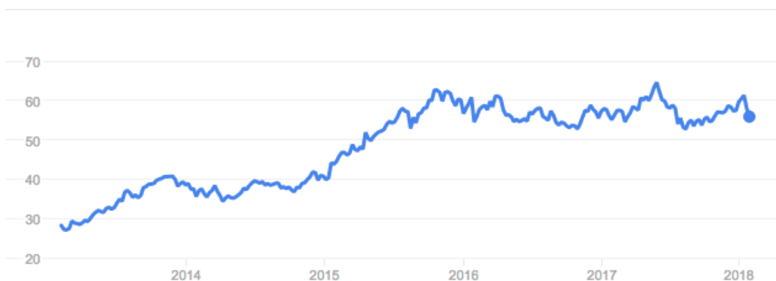
Obrázok 3 - Vývoj ceny akcií Starbucks