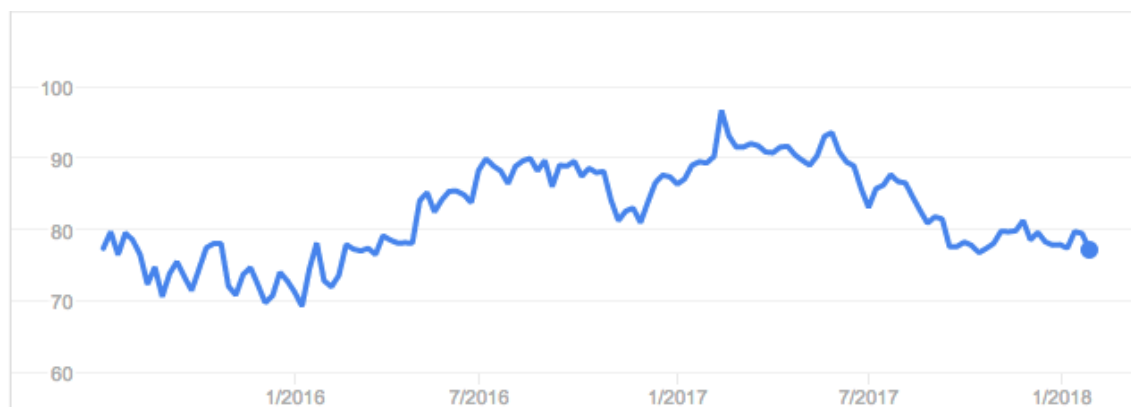
Obrázok 1 - Vývoj ceny akcií Kraft Heinz

Nie je tajomstvom že Buffett vkladá veľkú dôveru a finančné prostriedky do silných značiek a rovnako má rád aj spoločnosti ktoré boli spojené fúziou ako táto, a to spoločnosťou Kraft a spoločnosťou Heinz. Táto veľká spoločnosť jednoznačne spĺňa kritéria ktoré stanovuje Buffett pre zvolenie tých najlepších adeptov na úspech.