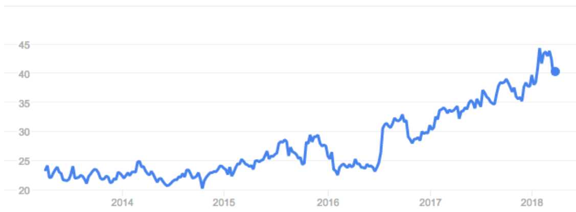
Obrázok 7 - Vývoj ceny akcií eBay

Spoločnosť eBay je veľmi populárna medzi širokou verejnosťou a to vďaka jednoduchému prístupu. No na trhu je veľa konkurentov ako napríklad Amazon či AliExpress, a z tých menších existuje mnoho aplikácií ktoré pôsobia v jednotlivých krajinách.