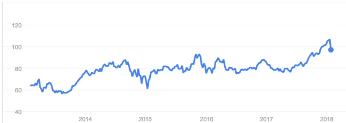
Obrázok 4 - Vývoj ceny akcií Phillips 66