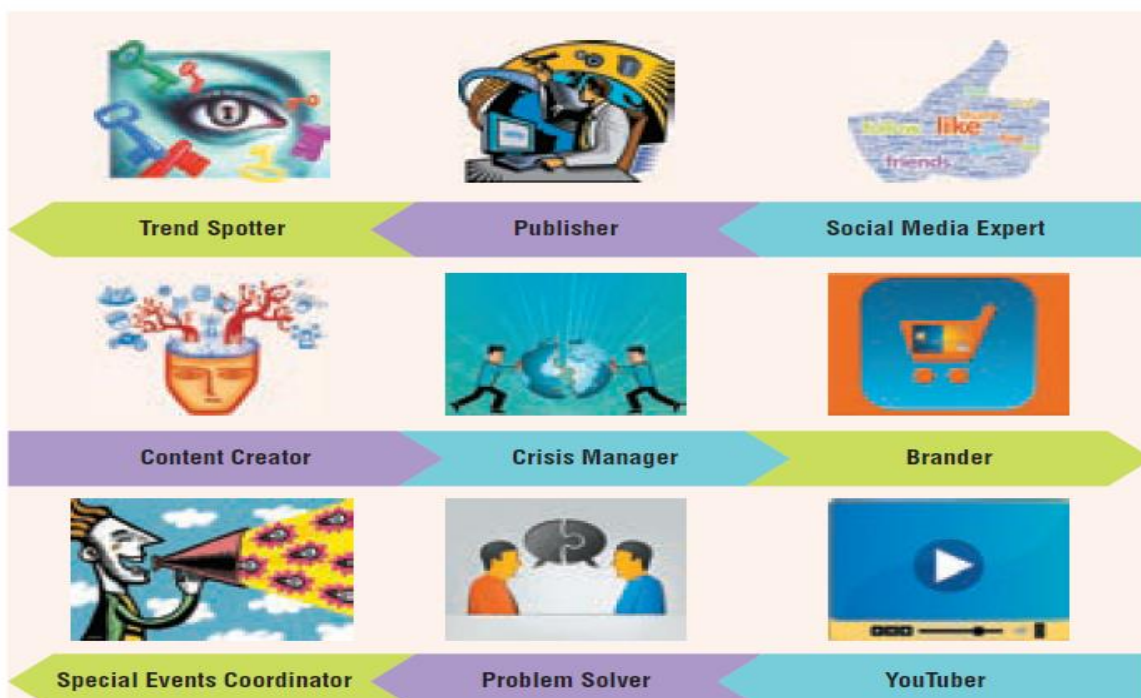
Obrázok č. 3 – Úlohy PR špecialistu