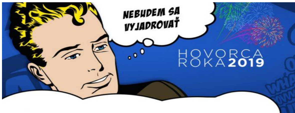
Obrázok č. 4 – Logo súťaže Hovorca roka