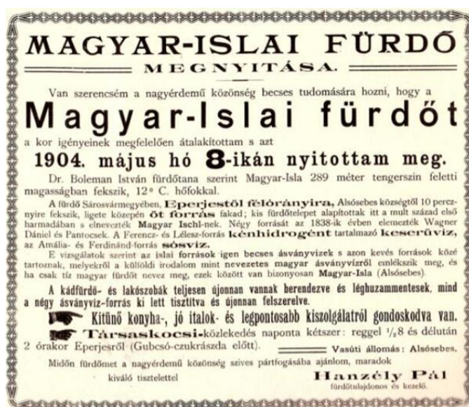
Obrázok 10: Pozvánka do Išle v maďarskom jazyku