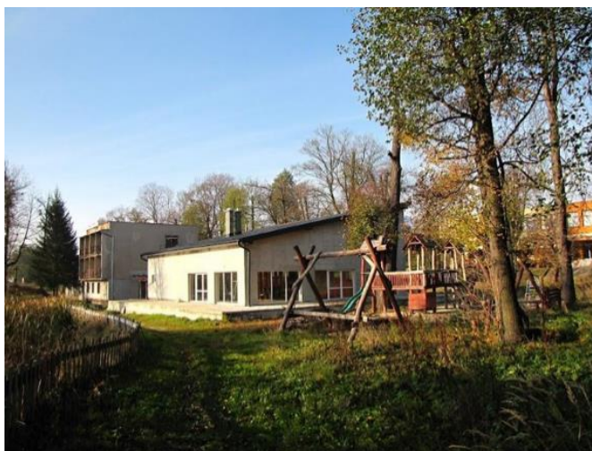
Obrázok 11: Budovy v areáli kúpeľov Išľa v súčasnosti