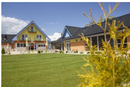
Obrázok 3: kúpele Gánovce v súčasnosti