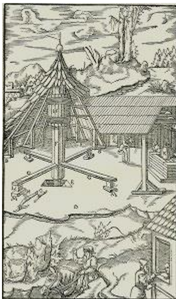
Obrázok 7: Gapeľ

V liečebnom dome sa nachádzalo pätnásť kúpeľných kabín, ktoré boli vybavené osemnástimi vaňami. Vody z prameňov sa čerpali pomocou zvieracej sily zo studní a odvádzali sa do spoločnej nádrže. Vodu následne ohrievali v kotloch a privádzali do kúpeľných kabín. Na čerpanie vody využívali technické zariadenie s názvom gapeľ. Toto zariadenie funguje na kruhový pohon, ktorý vytváral kôň alebo krava chôdzou do kruhu.