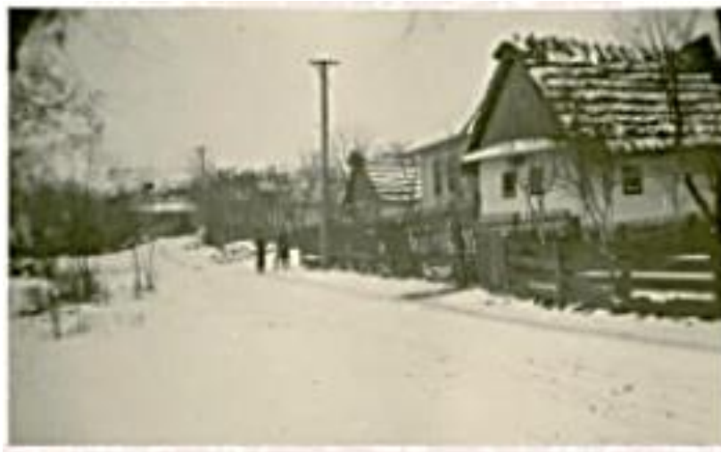
Obrázok 8: historická fotografia Nižnej Šebastovej