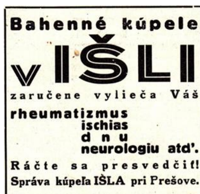
Obrázok 9: Reklama na bahenné kúpele v Išli

V kúpeľoch zaviedli aj bahenné kúpele, pripravované z ložísk rašeliny. Na prípravu bahenného kúpeľa sa využívala miestna rašelina, ktorá sa ťažila len približne 50 metrov od kúpeľného areálu. V kúpeľnom areáli sa nenachádzal dostatok izieb, aby sa mohli ubytovať všetci hostia naraz, preto hostia využívali možnosť ubytovania v blízkych domoch mestskej časti. Najčastejšími návštevníkmi kúpeľov bola najmä šľachta a obyvatelia z Prešova, patriaci k strednej vrstve.