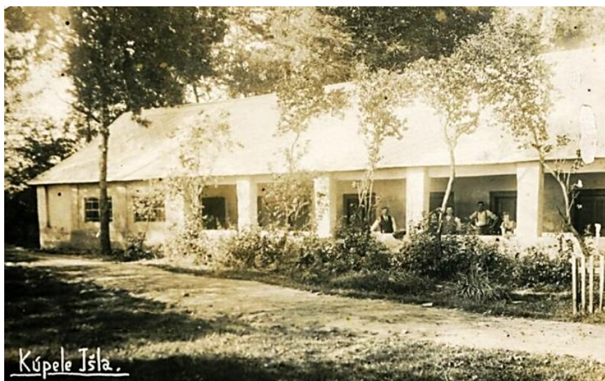
Obrázok 6: Budova v areáli kúpeľov Išľa v minulosti

Názov kúpeľov je inšpirovaný názvom rakúskych kúpeľov Bad Ischl. V roku 1838 pribudovali ku liečebnému ústavu jedáleň a hostinec. Okrem toho zriadili park, vysadili dreviny a taktiež vybudovali promenádu. Návštevníci si mohli spríjemniť svoj pobyt okrem relaxu v parku aj v tančiarňi. Vďaka zväčšeniu a zveľadeniu liečebného ústavu a jeho okolia sa v kúpeľoch Išľa rozprúdila čulá kúpeľná prevádzka a stávali sa čoraz populárnejšími.