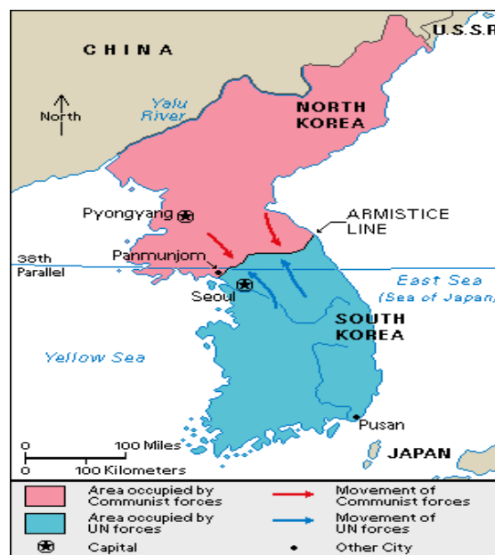
Obrázok č. 2: Rozdelenie Kórejského polostrova na 38 rovnobežke