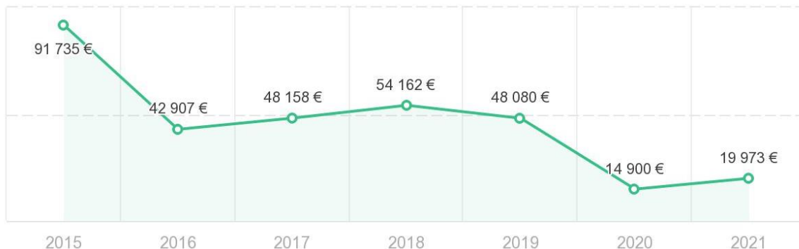
Graf č. 2: Tržby spoločnosti Golfies, s.r.o., počas rokov 2015 - 2021

V dôsledku pandémie klesli tržby spoločnosti Golfies, s.r.o v roku 2020 o 70% oproti predchádzajúcemu roku z 48 080 eur v roku 2019 na 14 900 eur v roku 2020 a výsledok hospodárenia spoločnosti súbežne klesol zo straty -375 eur v roku 2019 na ešte väčšiu stratu v sume -6 775 eur za rok 2020. Počas mierneho uvoľňovania protipandemických opatrení v nasledujúcom roku 2021 zaznamenala spoločnosť len mierny rast tržieb o približne 5 000 eur, na druhej strane výsledok hospodárenia vzrástol do plusu a firma tak vygenerovala zisk za tento rok 1 040 eur.