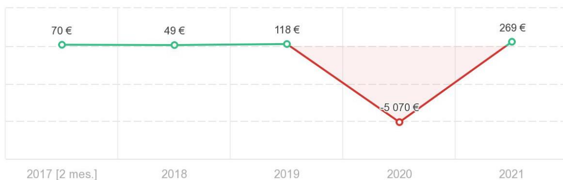
Graf č. 3: Výsledok hospodárenia spoločnosti KASHAZULU FILMS, s.r.o., počas rokov 2017 - 2021