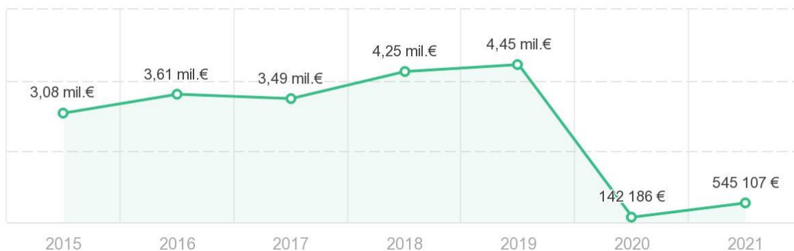
Graf č. 1: Tržby spoločnosti CHILL FESTIVAL, s.r.o. počas rokov 2015 - 2021

Festival Chill sa počas pandemických rokov 2020 a 2021 síce uskutočňoval, avšak s výraznými hospodárskymi ťažkosťami. Spoločnosť vykazovala markantné straty oproti predošlým rokom. Tržby, najmä z predaja lístkov a priestorov pre firmy, sa v roku 2020 znížili o 97% a počas roku 2021 jemne zvýšili, vďaka miernemu uvoľneniu opatrení. Spoločnosť bola nútená podniknúť také ekonomické kroky, aby zabezpečila svoje fungovanie po ďalšie roky. Množstvo firiem podľahlo pandemickej kríze a buď skrachovalo alebo zredukovalo počty svojich zamestnancov. Chill však chcela nájsť iné východisko z krízy a nemala v záujme prepúšťať svojich zamestnancov či prerušovať svoju dlhoročnú tradíciu v organizovaní festivalu.