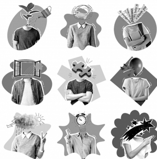
Obrázek 1 Ukázka infografiky projektu Školní wellbeing do třídnických hodin (ČT Edu, 2023).

náročnost pro učitele, nutnost spolupráce s psychologem či možnost realizace bez podpory školního poradenského pracoviště, návrhy pro reflexi a sebereflexi, projekt je graficky přizpůsobený dospívajícím, je určen pro druhý stupeň a střední školu) 1 .