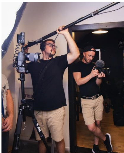
Obrázok 5 - Tím Vizart pri práci

Vizart sa teda plánuje špecializovať na jedno konkrétne odvetvie, aby sa stal odborníkom v tejto oblasti a poskytoval svojim klientom efektívnejšie riešenia. Spoločnosť Vizart dúfa, že vykonaním prieskumu a získaním podnetov od klientov a odborníkov z odvetvia sa jej podarí identifikovať odvetvie, ktoré bude poskytovať najväčšiu hodnotu, a že sa v tejto oblasti stane lídrom.