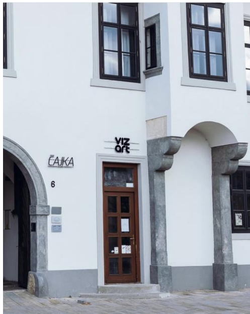
Obrázok 4 - Fotografia vchodu do kancelárskych priestorov

Súčasne Vizart je v expanzii a zamestnáva 8 ľudí na plný úväzok a 4 ľudí na skrátenej úväzok, pričom hľadá nových členov. V čase písania tejto záverečnej práce firma prechádza reorganizáciou priestorov, aby mohla poskytnúť priestor pre nových zamestnancov, aby pokryli potreby približne 26 dlhodobých spoluprác a niekoľko jednorazových. Firma sídli v centre Trnavy v historickom dome, kde disponuje veľkými kancelárskymi priestormi. V priestoroch môžeme nájsť hlavný kancelársky priestor, mini zasadačku pre stretnutia, sklad a po novom aj malú kuchynku a nahrávacie štúdio na podcasty, ktoré sa bude prenajímať. Klientela je hlavne v meste Trnava a v jej okolí. Po rozšírení kapacít sa agentúra bude snažiť zamerať na Bratislavu a stredne a väčšie podniky. Keď už sme pri väčších podnikoch, Vizart sa podarilo prednedávnom nadviazať spoluprácu s najväčším auto predajcom v Trnave s názvom Begam. Tím je na túto spoluprácu hrdý, pretože je to pre nich ďalší míľnik vo veľkosti projektov.