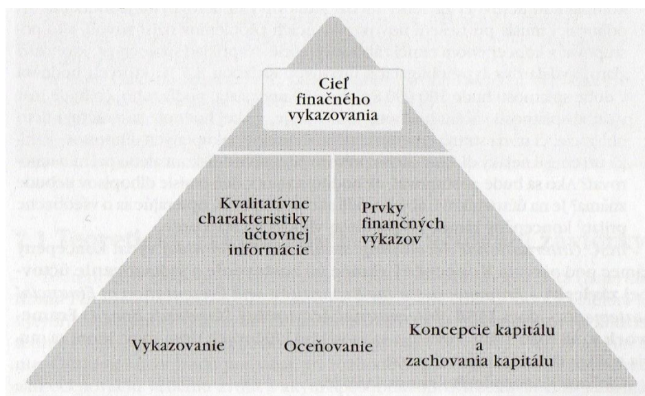
Schéma č. 2 Konceptný rámec IASB

Zdroj: KRIŠTOFÍK, Peter – ŠURANOVÁ, Zuzana – SAXUNOVÁ, Darina. Finančné účtovníctvo a riadenie s aplikáciou IFRS . 2. vydanie. Bratislava: Iura Edition, 2011. s. 38. ISBN 978-80-8078-396-9.