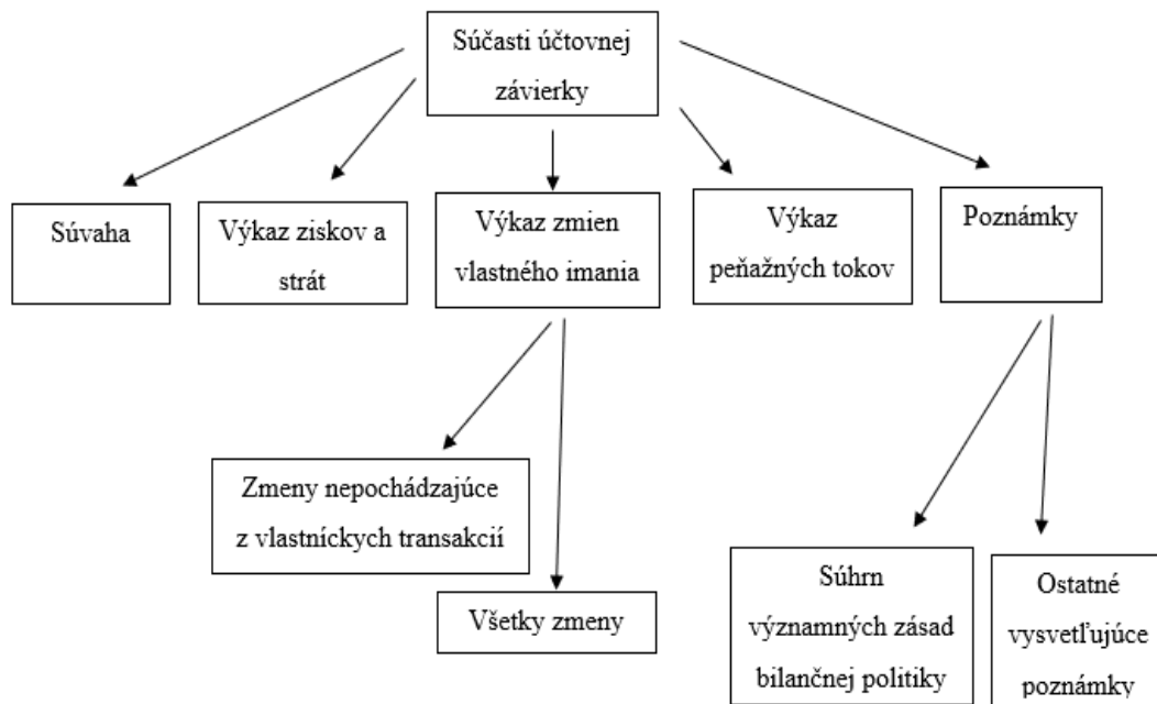
Schéma č. 3 Súčasti účtovnej závierky