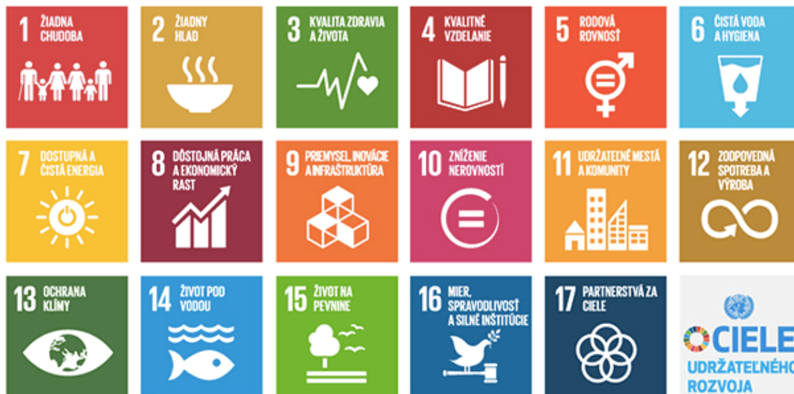
Obrázok 2: Ciele udržateľného rozvoja Agendy 2030