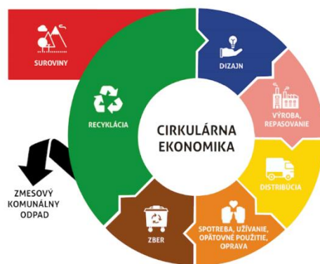
Obrázok 1 - Rozdiel medzi lineárnym a obehovým hospodárstvom