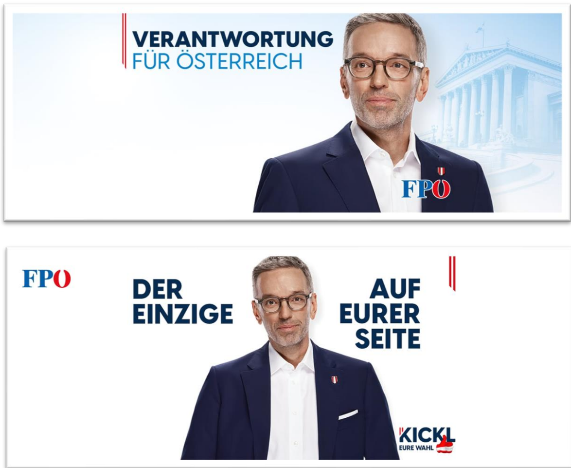
Abbildung 4 und 5