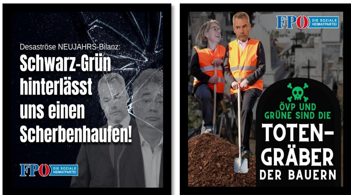
Abbildung 9 und 10