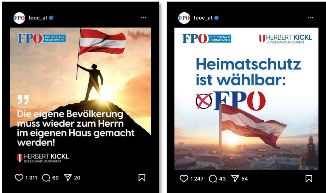
Abbildung 11 und 12