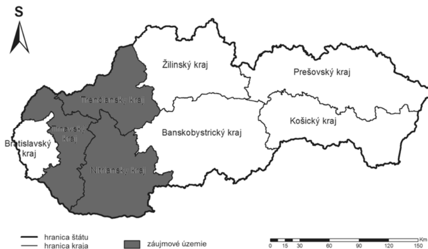
Map 1: Region NUTS II – Western Slovakia