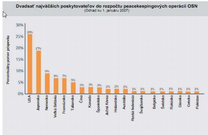
Graf č. 1: Krajiny s najväčším príspevkom do rozpočtu peacekeepingových operácií OSN

Adaptáciu BR tak predstavujú rôzne verzie rozšírenia o stálych a nestálych členov. Medzi najviac anticipujúcich patria krajiny tzv. G4, Japonsko, India, Nemecko a Brazília. Svoju kandidatúru o kreslá stálych členov odôvodňujú jednak postavením v medzinárodných vzťahoch, ako aj veľkosťou príspevkov do rozpočtu organizácie. 66