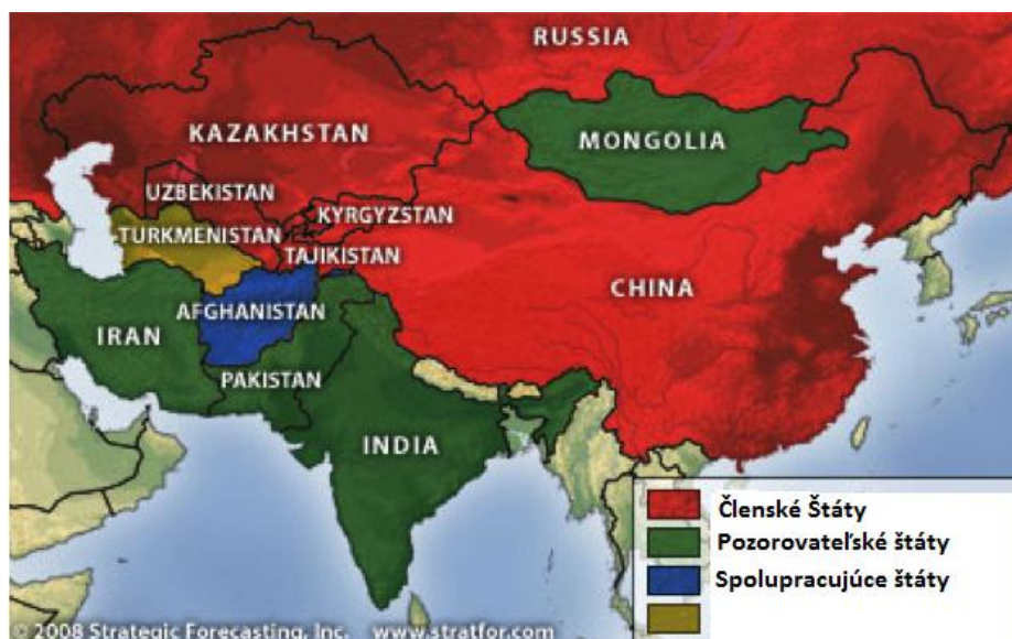
Mapa č. 1: Šanghajska Organizácia Spolupráce 3

Šanghajska organizácia spolupráce (ŠOS) je organizáciou ktorá pokrýva jednu z najväčších geografických oblastí v rámci regionálnych organizácií, od Kaliningradu po Vladivostok a od Bieleho mora po Juhočínske more vid' mapa č. 1. Jej členské a pozorovateľské štáty vlastnia 17,5% dokázaných ropných rezerv, 47-50 % známych rezerv zemného plynu a pokrývajú približne 45% svetovej populácie 2