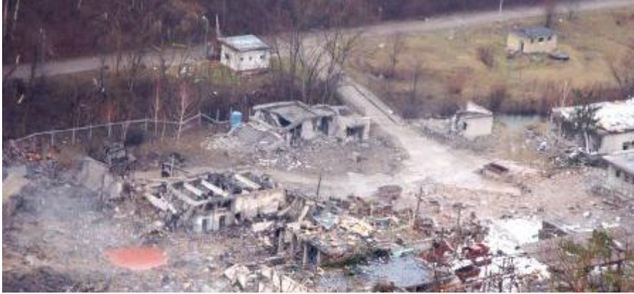
Obrázok 1. Totálna devastácia VOP v Novákoch po aktivovanom vnútornom riziku, vyplývajúcom z ľudského činiteľa.