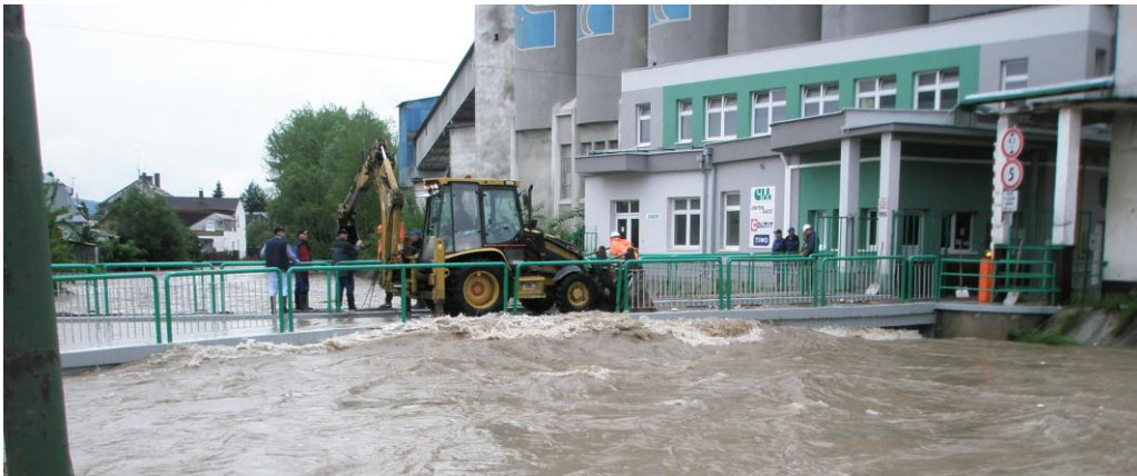
Obrázok 2. Zaplavený priemyselný podnik ako dôsledok aktivovaných vonkajších prírodných rizík