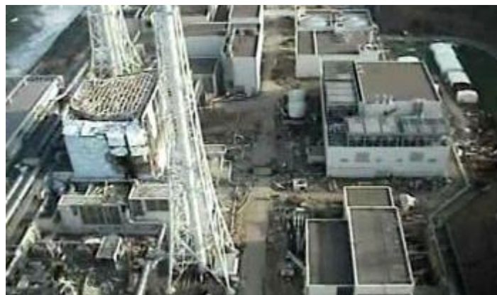
Obrázok 3. Havária v jadrovej elektrárni vo Fukušime ako dôsledok reťazenia viacerých aktivovaných vonkajších a vnútorných rizík